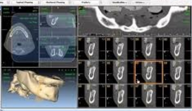
DIAGNOSTICO DIGITAL 3D