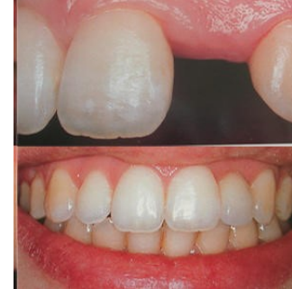
MÚLTIPLES ALTERNATIVAS PROTÉSICAS CARGA INMEDIATA IMPLANTES Y DIENTES EN UN DÍA